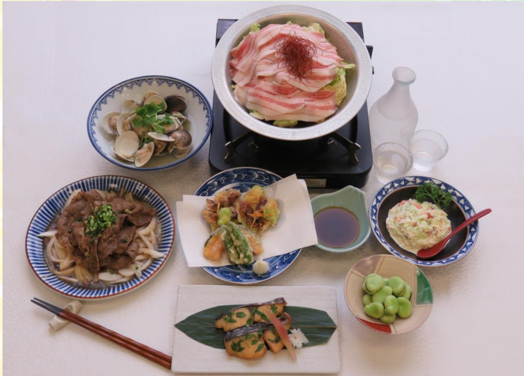
春キャベツと火の本豚の鍋、洋食屋さんのコールスローサラダ、蚕豆塩ゆで、日本産鱈の木の芽焼き、蛍烏賊と蚕豆のかき揚げ、牛肉ポン酢焼きと新玉葱のスライス、蛤酒蒸し