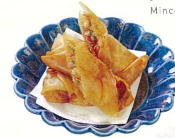
和風春巻き $80 Spring Rolls Japanese Style