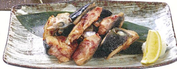
縞ホッケ $180 Atka Mackerel