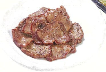
葱タン塩焼き $100 Beef Tongue with Spring Onion