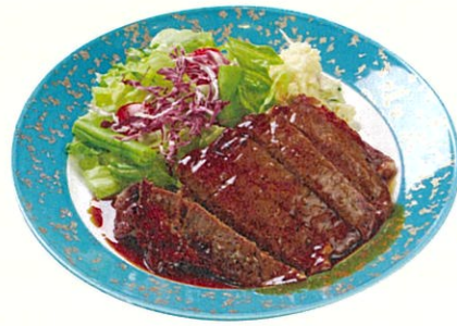
牛肉照焼き $230 Teriyaki Beef