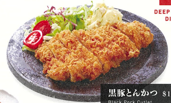
黒豚とんかつ $170 Black Pork Cutlet