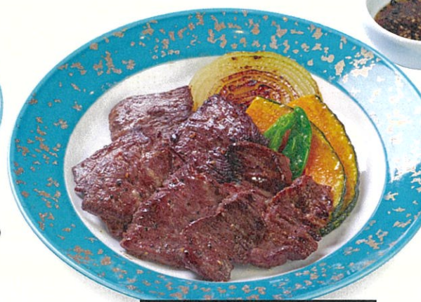
牛ハラミ焼肉風 Beef Skirt Steak, Japanese BBQ Style $240