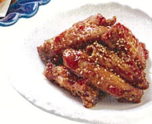
甘辛やみつき手羽 $100 Sweet and Sour Fried Chicken Wing