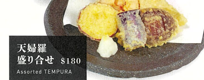
天婦羅盛り合せ $180 Assorted TEMPURA