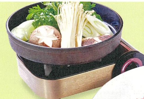
US牛すき焼き/しゃぶしゃぶ $420 US Beef SUKIYAKI/ SHABU SHABU